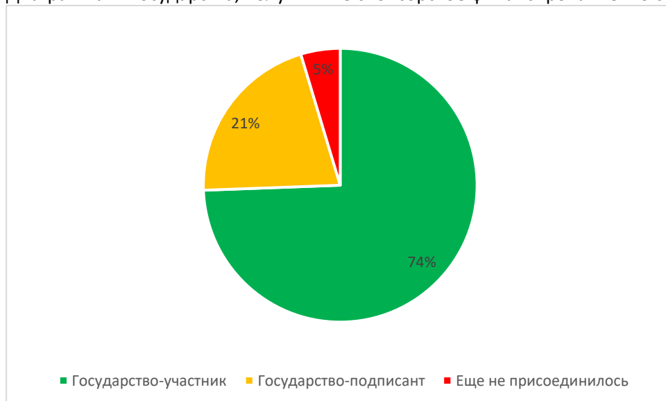
Диаграмма 2. Государства, получившие спонсорское финансирование: по статусу ДТО